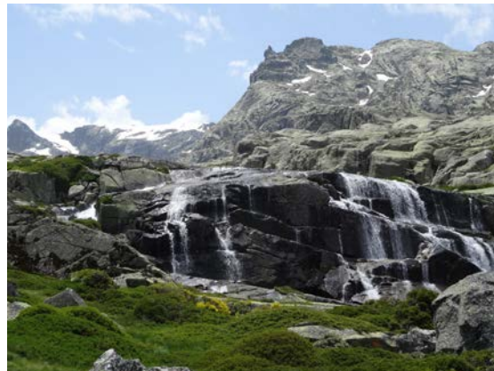
En la foto de la izquierda puedes observar el refugio de la Barranca. La ruta continúa por zona de piedras junto a paisajes espectaculares con cascadas como la de la foto de la derecha.

Ahora el sendero se irá difuminando hasta desaparecer por completo. Estamos en una zona pedregosa donde las ayudas para avanzar serán nuestras piernas y, como guía, los montones de piedras acumulados a lo largo del camino. Sin embargo, es tan simple como seguir subiendo recto y paralelo al río, que se transformará en un conjunto de cascadas según vamos cogiendo altitud. El próximo hito: la laguna de Majalaescoba. Un lugar precioso e ideal para refrescarse en verano y hacer una pausa para comer, descansar o, simplemente contemplar el paisaje (la verás en la primera foto de este documento). ¡Ya queda menos, pero ahora viene lo más duro!