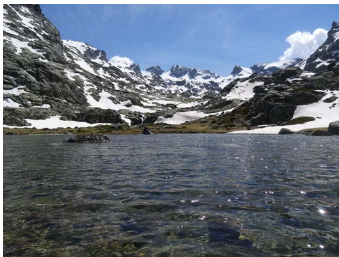
Laguna de Majalaescoba en primavera

Una de nuestras rutas favoritas por la Sierra de Gredos es la subida a las Cinco Lagunas. Una serie de lagunas consecutivas creadas por la acción erosiva de los grandes glaciares que se formaron en el Alto Gredos durante el Pleistoceno.