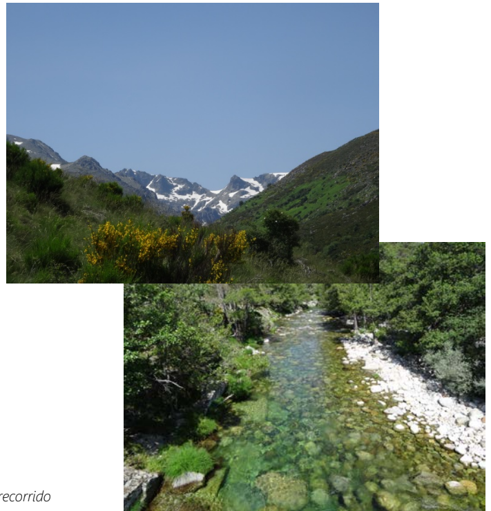
Aquí tienes algunas fotografías que hemos tomado al inicio del recorrido

Después de una buena caminata andando paralelos al río (Garganta del Pinar), veremos el final del valle. El sendero desemboca en una zona de pradera de pasto, casi llana, que finaliza en el refugio de La Barranca (1.636m), junto a la Cuerda del Cervunal. Este refugio es idóneo para comer, descansar, o si has preferido no madrugar y vas a hacer el itinerario en más de un día podrás pasar allí la noche. A partir del refugio... ¡comienza la aventura!